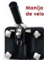
Manija retráctil y regulador de velocidad