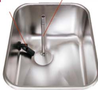
Tubo de caída.